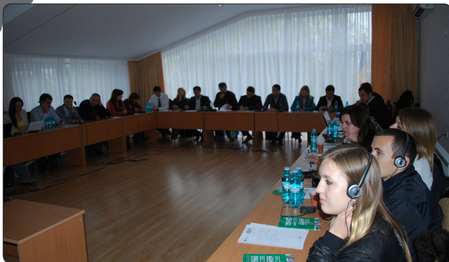
Grup de Lucru pe Dezvoltare Regională cu participarea reprezentanților din Transnistria.