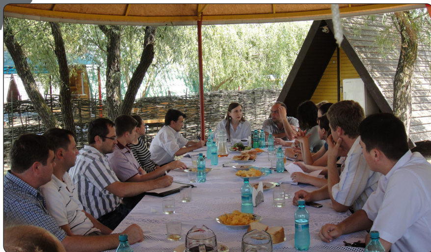
„Negocierile cu privire la intrarea în faza 2 a planului de acțiuni privind regimul liberalizat de vize” discutate la Costești