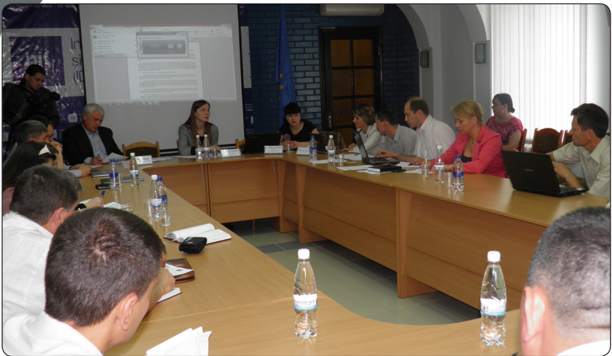
Experții discutând despre prevenirea și combaterea crimei organizate