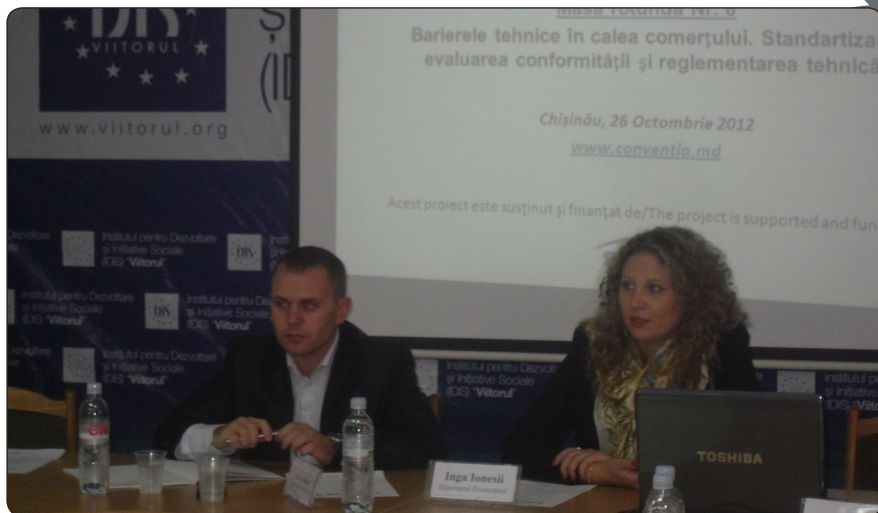
Moderarea Grupului de Lucru pe Comerț, Servicii, Concurență