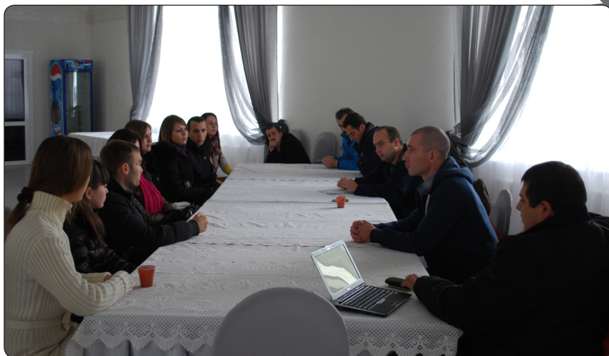
Reprezentanții din Transnistria la Grupul de Lucru pe Dezvoltare Regională