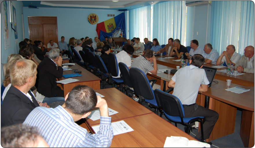
Convenția Națională pentru Integrare Europeană la Cahul, 20 septembrie 2012