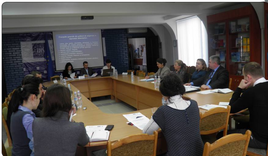
Participanții la Grupul de Lucru pe Comerț, Servicii, Concurență din 12 aprilie 2012