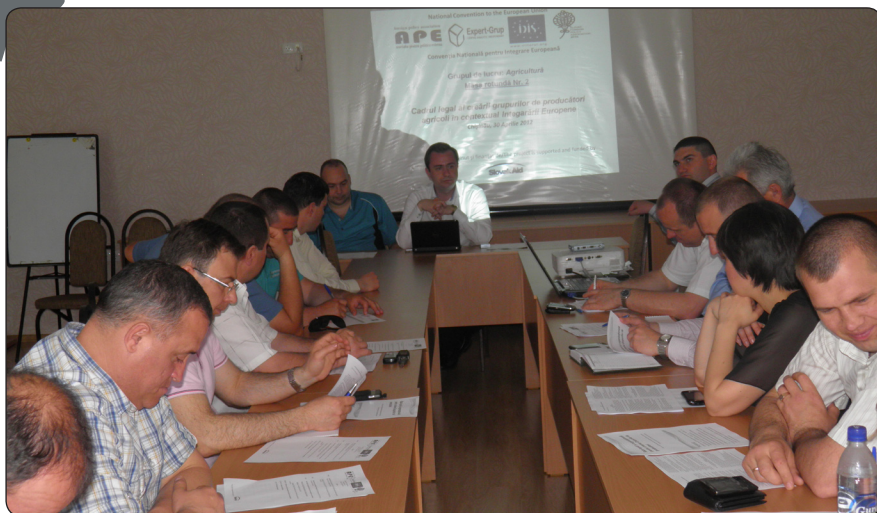
Reprezentanții Ministerului Agriculturii și Industriei Alimentare dar și a Societății Civile la Grupul de Lucru pe Agricultură