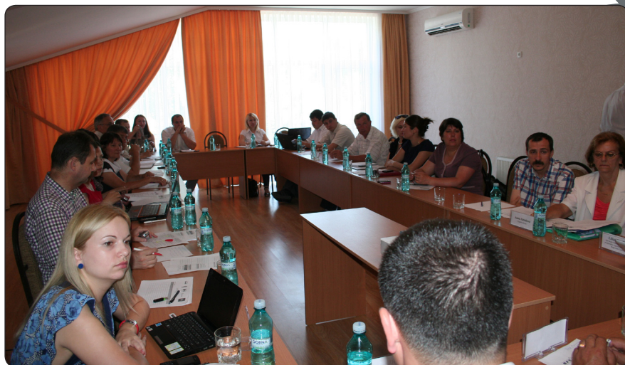
"Strategiile și programele de cooperare teritorială Europene – noi perspective de dezvoltare regională în Republica Moldova" discutate în cadrul Grupului de Lucru nr.3