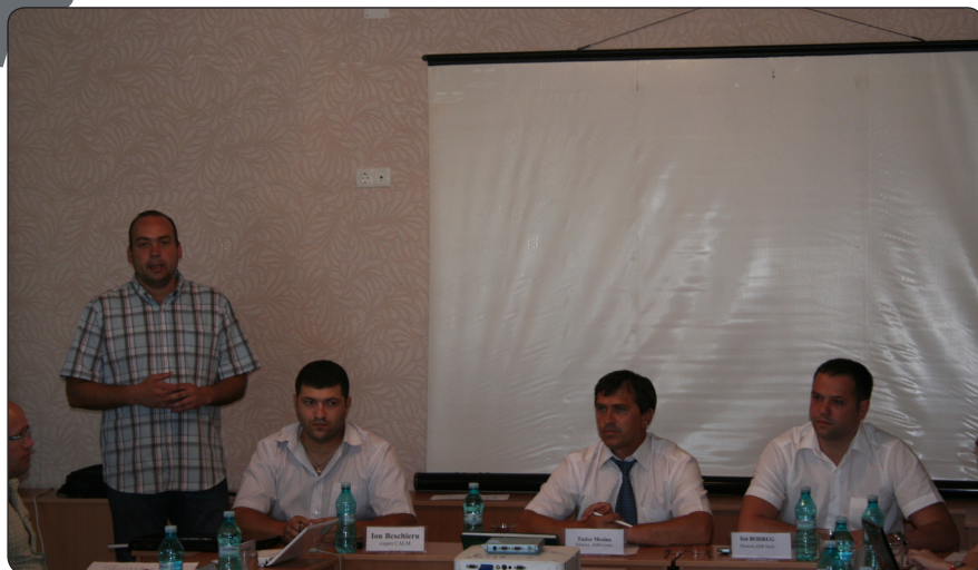
Reprezentanții ADR Centru și ADR Nord moderând împreună cu reprezentanții Societății Civile Grupul de Lucru pe Dezvoltare Regională